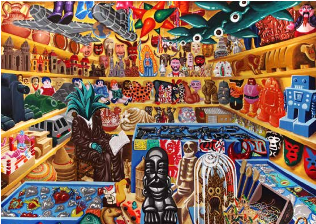
Hervé Di Rosa , Tienda del Señor Maguey , 2000, acrylique sur toile, 220 x 246 cm

exposition du 22 octobre 2016 au 22 janvier 2017