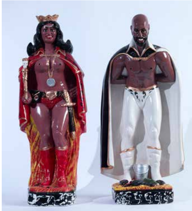
Anonyme , catcheurs, Collection Hervé Di Rosa © Pierre Schwartz

exposition du 22 octobre 2016 au 22 janvier 2017