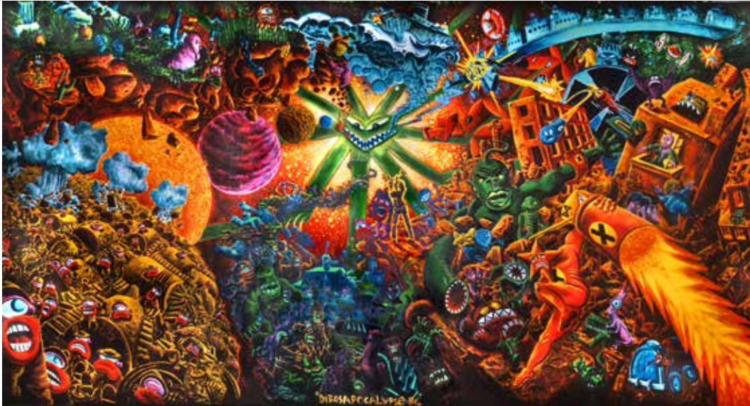
Hervé Di Rosa , Diosapocalypse , 1984, 400 x 800 cm, acrylique sur toile © Adagp / Pierre Schwartz

exposition du 22 octobre 2016 au 22 janvier 2017