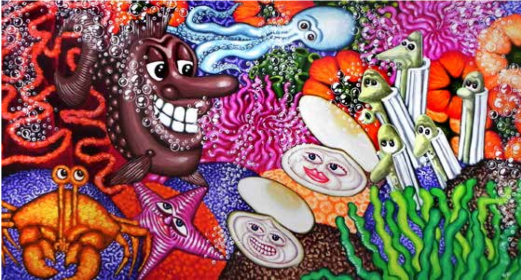
Hervé Di Rosa , Sous-marin aux coraux , acrylique sur toile, 112 x 120 cm

exposition du 22 octobre 2016 au 22 janvier 2017