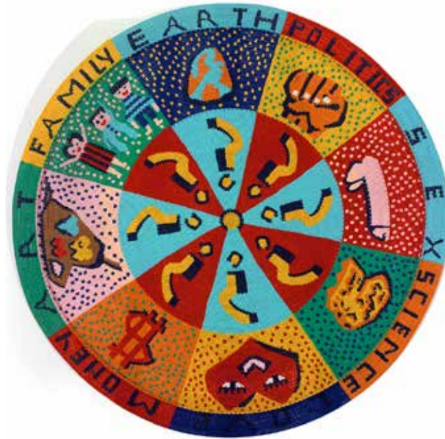
Hervé Di Rosa , Les éléments de la vie , Afrique du Sud, 1998, cables de téléphone en plastique tressés

exposition du 22 octobre 2016 au 22 janvier 2017