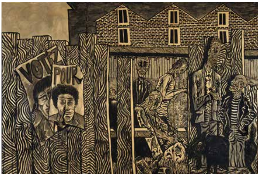
Hervé Di Rosa , La vie des pauvres , 1993, encre de chine sur papier