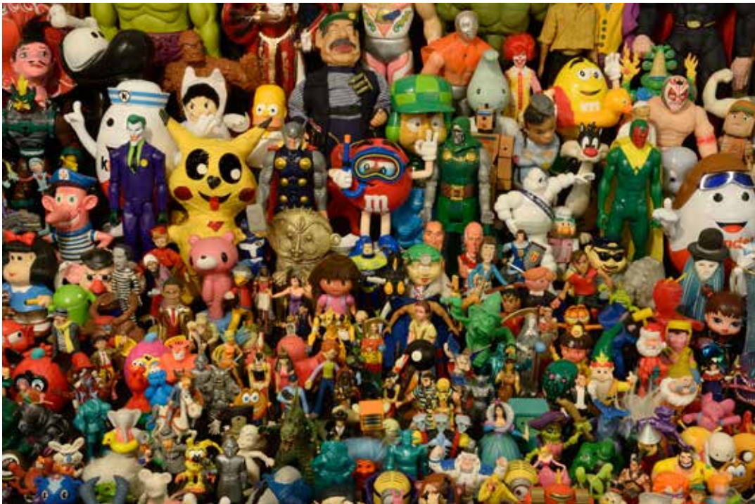
Collection de jouets et de figurines d'Hervé Di Rosa, 2016