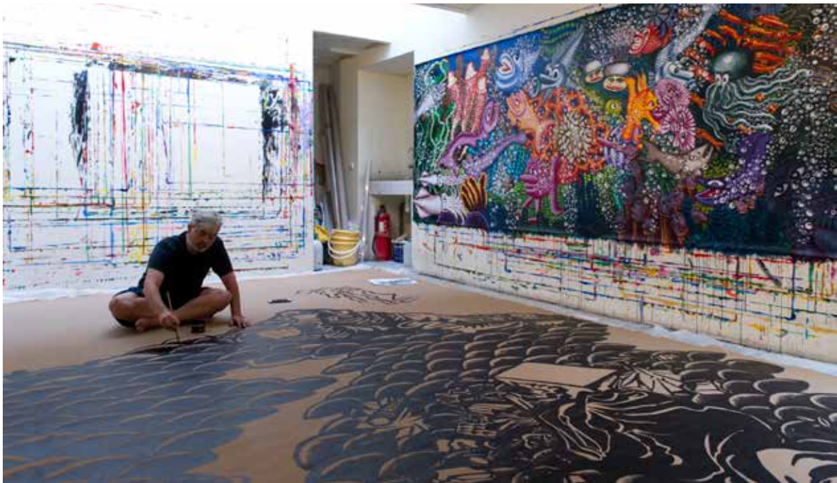
Hervé Di Rosa dans son atelier, Paris, 2016