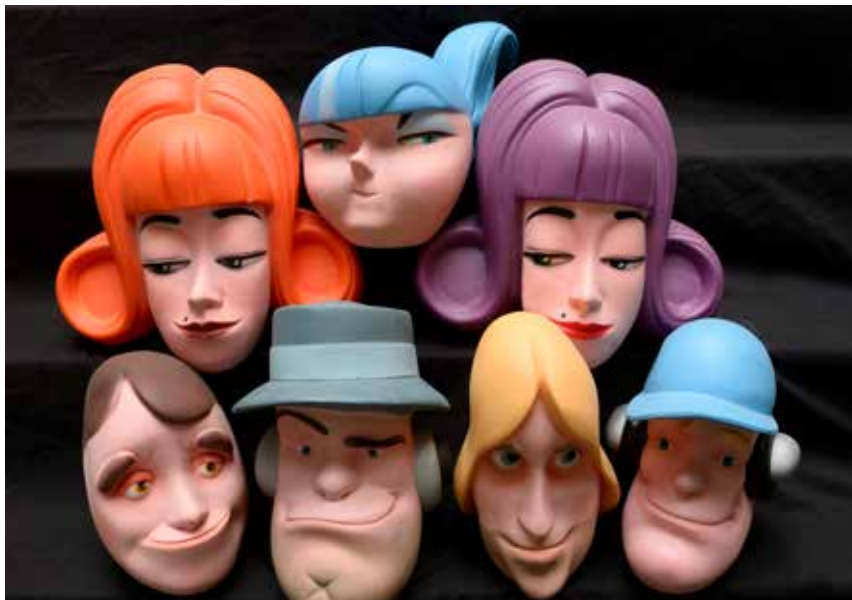
Anonyme , têtes en plastique, Espagne. Collection Hervé Di Rosa