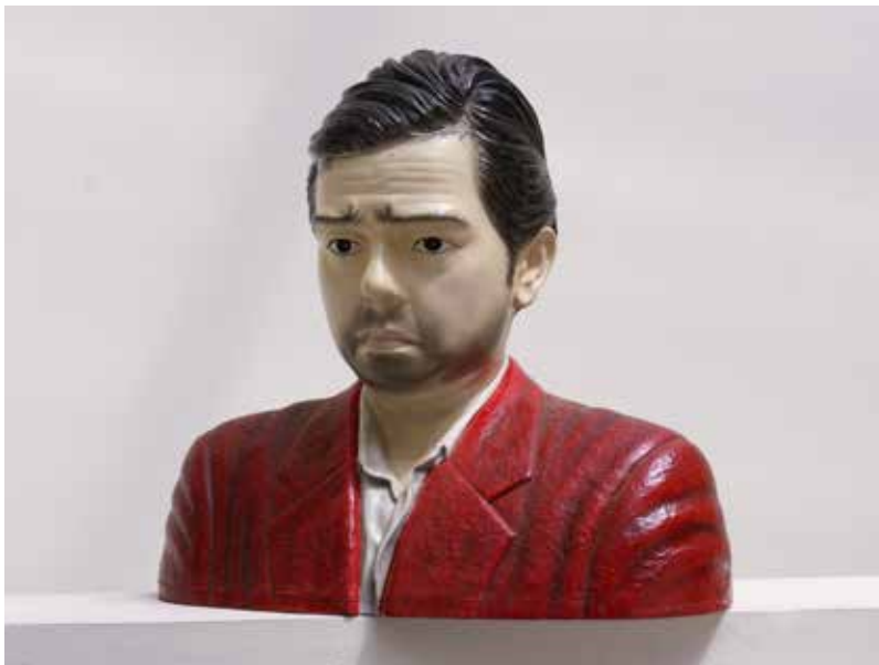
Hervé Di Rosa et anonyme , Buste d'Hervé Di Rosa , 1998, plâtre et céramique © Adagp / Pierre Schwartz