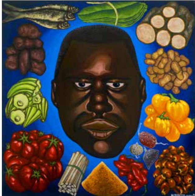
Hervé Di Rosa , Tête aux petits tas , Ghana, 1994, huile sur panneau de bois, 122 x 122 cm

exposition du 22 octobre 2016 au 22 janvier 2017