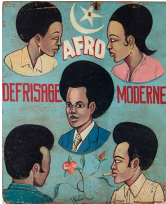
Anonyme , enseigne de coiffeur, Ghana. Collection Hervé Di Rosa