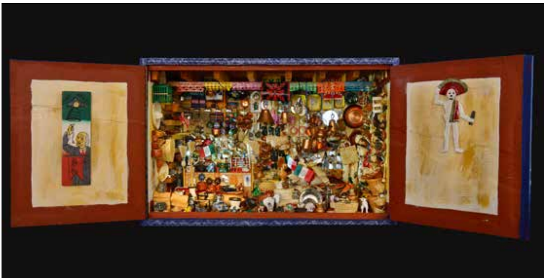
Anonyme , boîte boutique miniature, Mexique, matériaux divers, 55 x 30 x 30 cm (fermée)