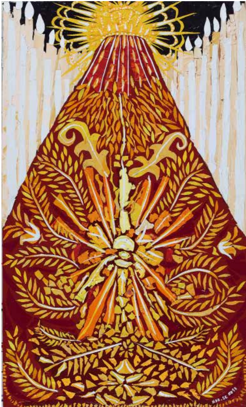
Hervé Di Rosa , El manto grande , 2013, acrylique sur bois, 60,5 x 121 x 7 cm. Collection Antoine de Galbert © Adagp / Pierre Schwartz

exposition du 22 octobre 2016 au 22 janvier 2017