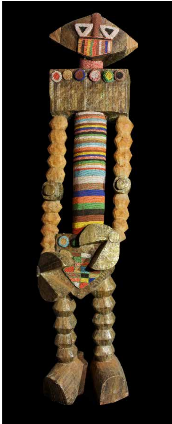
Hervé Di Rosa , Robot top model , Cameroun, 2013, bois, bronze, perles, hauteur: 252 cm © Adagp / Pierre Schwartz

exposition du 22 octobre 2016 au 22 janvier 2017