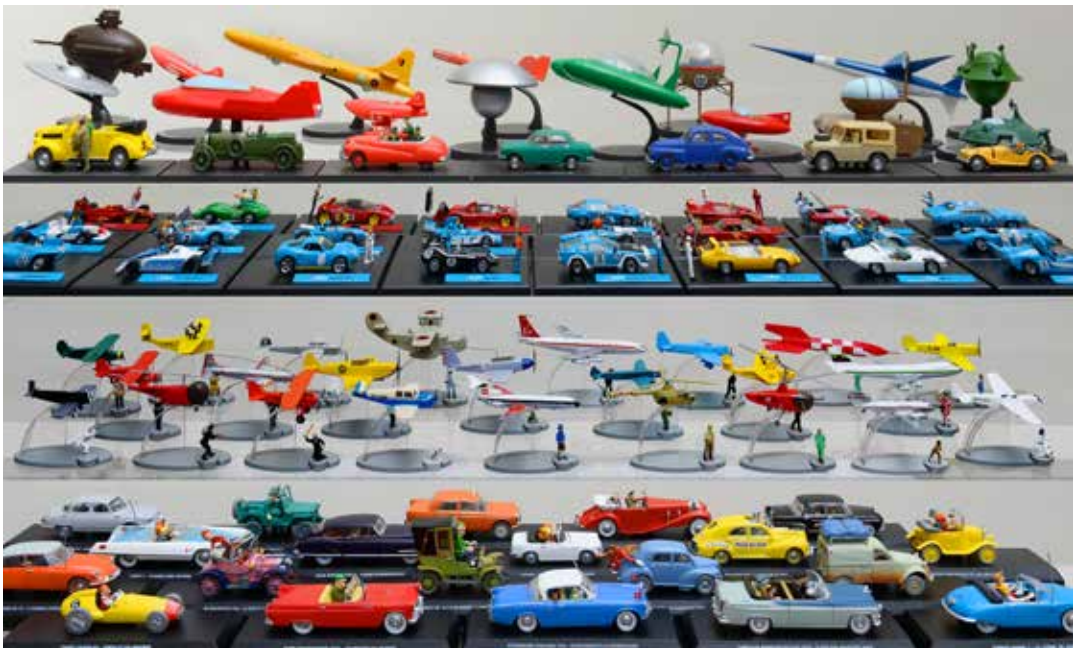
Collection de véhicules d'Hervé Di Rosa, 2016